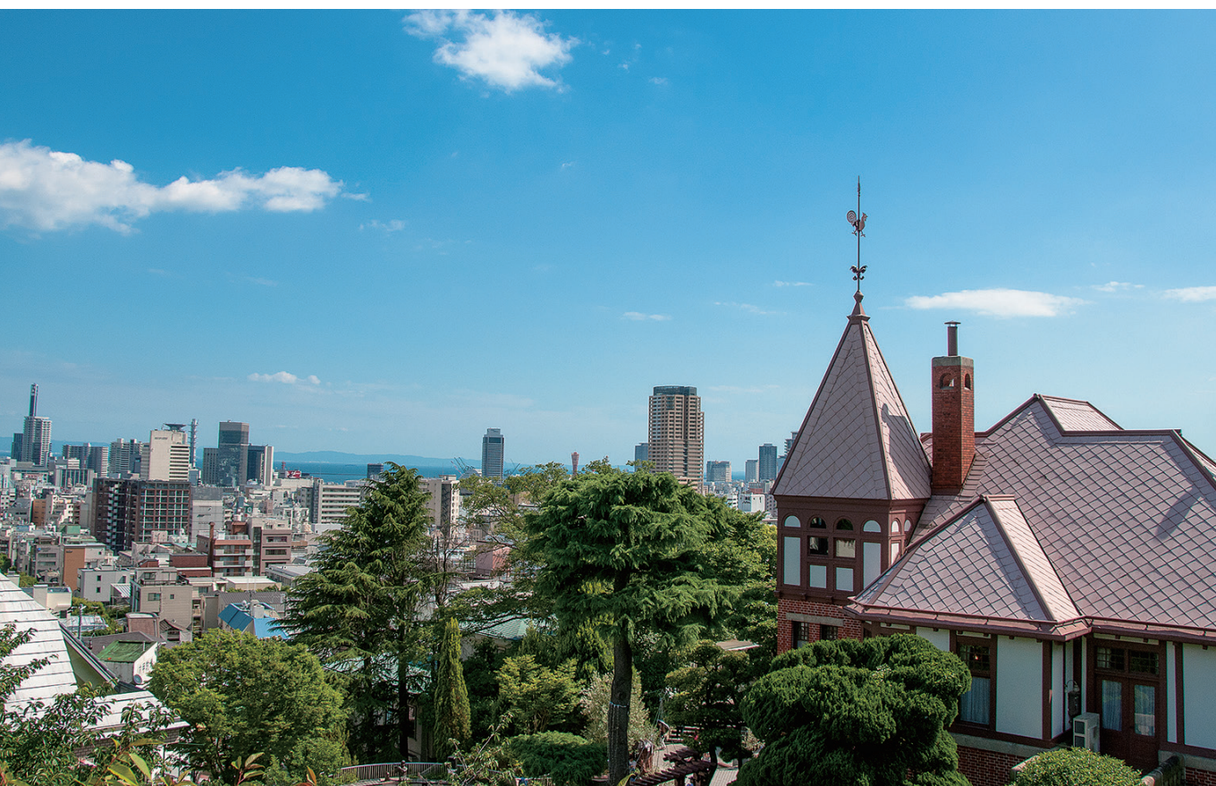
風見鶏の館(神戸北野異人館)